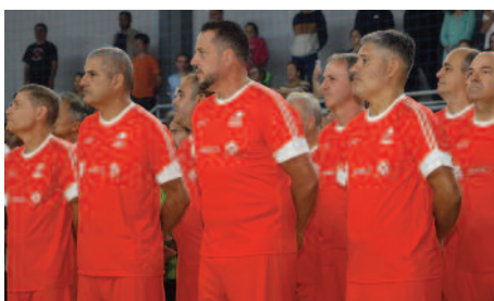
Legends do Futsal: ex-atletas da seleção brasileira