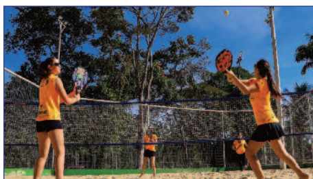
Torneio de Beach Tennis Sicoob Divicred: 200 atletas

Esportes, shows, competições e entretenimento entraram no calendário festivo do Estrela