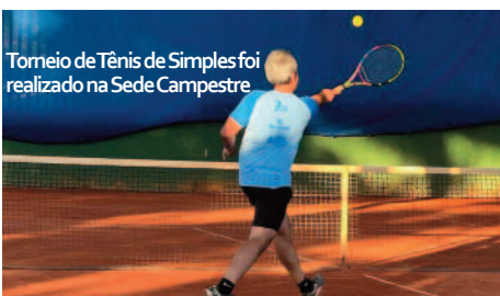
Torneio de Tênis de Simples foi realizado na Sede Campestre