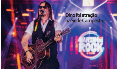
Dino foi atração na Sede Campestre