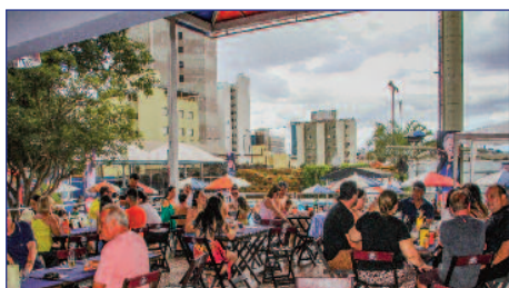
Restaurante foi revitalizado e ganhou um amplo deck

Contas do clube foram organizadas e todas as áreas esportivas foram reestruturadas