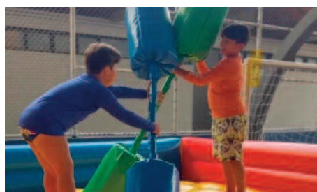
Semana das Crianças divertida na Urbana e Campestre