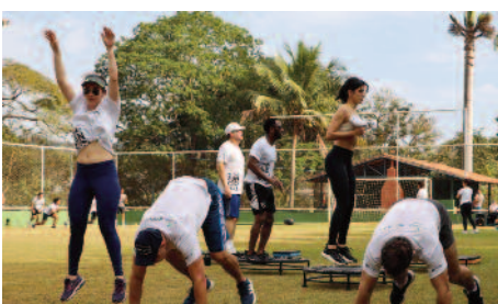
Treino Funcional: atividades com a café e camisa