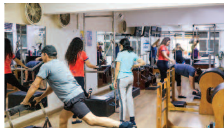
Pilates foi reestruturado e ganhou nova sala