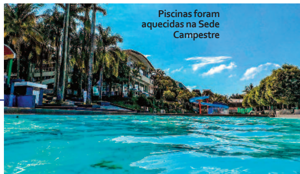
Piscinas foram aquecidas na Sede Campestre