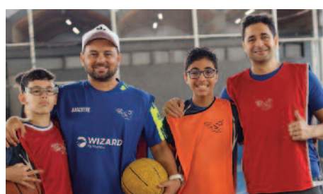
Filhos e pais participaram do 2º Festival de Basquete