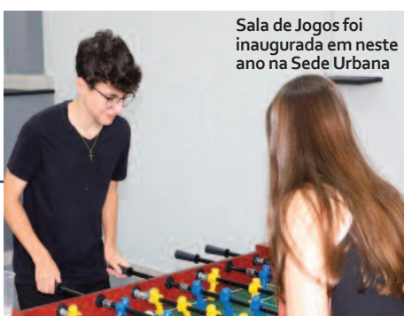
Sala de Jogos foi inaugurada em neste ano na Sede Urbana