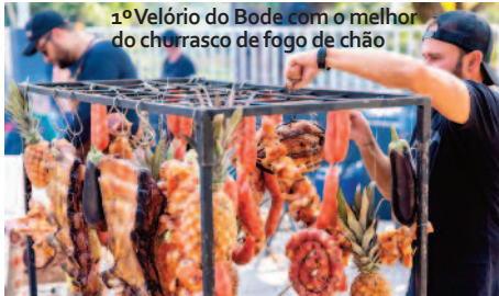
1º Velório do Bode com o melhor do churrasco de fogo de chão