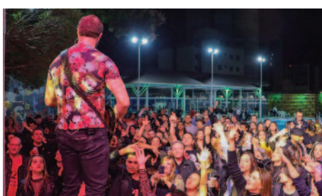
Rock Estrela Festival: nomes consagrados do cenário