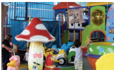
Sede Campestre ganhou um parquinho para crianças