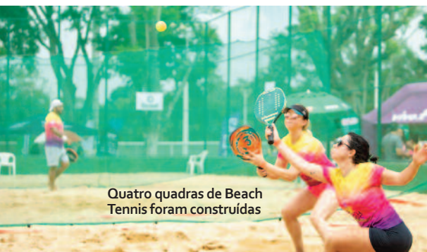
Quatro quadras de Beach Tennis foram construídas

O Estrela Playres também foi outro espaço criado para diversão e lazer neste ano.