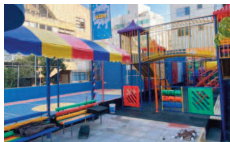
Sede Urbana também foi contemplada com brinquedos