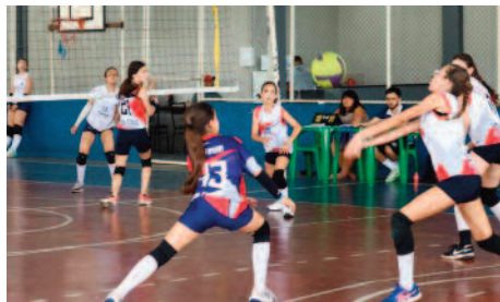
Liga de Vôlei reuniu 200 atletas da região Centro-Oeste