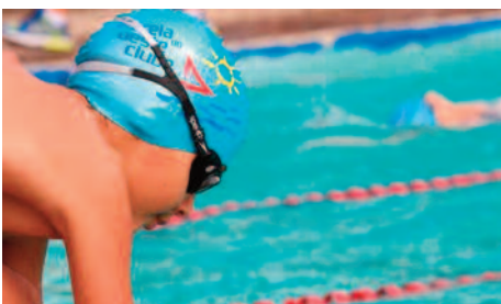
Estrela foi sede do Circuito Mineiro de Natação Vinculada