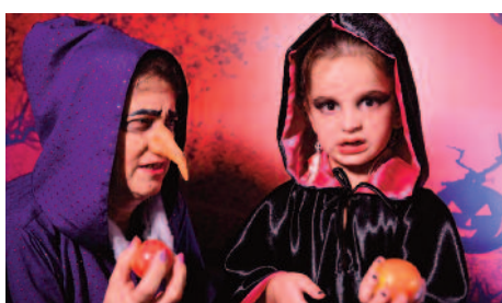
Halloween 2024 marcou o aniversário do clube