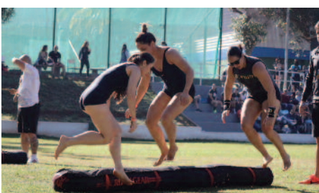
Maior evento de Crossfit da região foi no Estrela